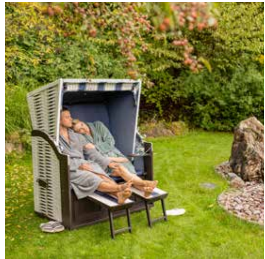
links: Heilwasserbrunnen in Wandelhalle oben: Salzgrotte im Kurhaus Vital-Brunnen unten: Saunagarten im Kurhaus Vital-Brunnen