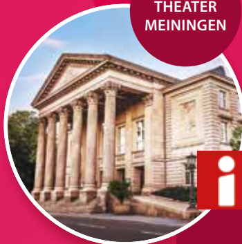
STAATS- THEATER MEININGEN